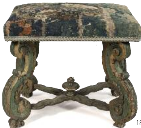
183. GROUPE en noyer sculpté en ronde-bosse polychrome et or, représentant le Christ en croix, perizonium noué à droite, les mains repliées, la Croix fichée dans le Calvaire, encadrée par la Vierge Marie, Marie-Madeleine et Marie Cléophas. Époque fin XVII e siècle. 148 x 90 x 40 cm. Restaurations et petits accidents, croix rapportée. 1 800 / 3 000 €