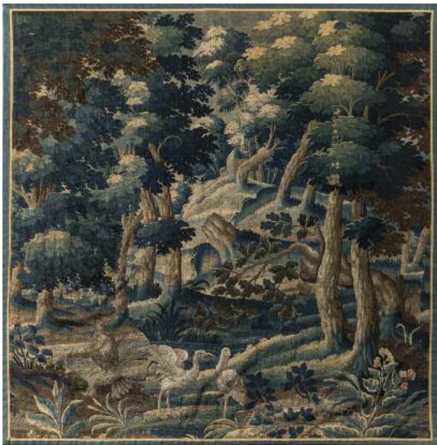
178. TAPIS Afghan Kerki , chaîne trame velours laine, à décor géométrique sur fond rouge. Époque seconde moitié du XX e siècle. 208 x 157 cm. Quelques usures et traces de mite. RS 80 / 100 €